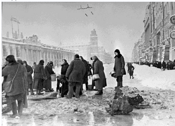
Жители блокадного Ленинграда набирают воду, появившуюся после артобстрела в пробоинах в асфальте на Невском проспекте. Декабрь 1941 г.

Продовольственные склады города были уничтожены фашистами. Ленинградцы голодали. Ели все, что можно было съесть: варили суп из крапивы, столярный клей с лавровым листом. В теплое время года в парках выращивали овощи, прямо под обстрелами рыбачили на Неве. Ленинградцам выдавались хлебные пайки.