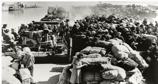
Ладога. «Дорога жизни». 1942 год.

высоковольтный электрический кабель позволял поставлять в Ленинград электроэнергию с Волховской ГЭС; трубопровод, который также проходил по дну Ладоги, снабжал город топливом. На Дороге жизни было занято около 19 тысяч человек, 3800 грузовых машин, автобусов, тракторов, работало три полевых госпиталя. Это было настоящее чудо логистики, аналогов которому не существует в истории.