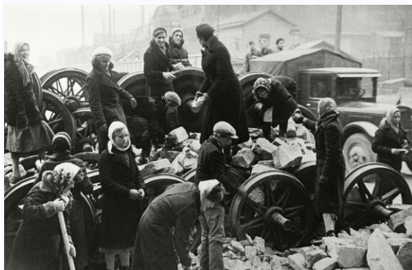
Сооружение баррикад на проспекте Стачек у Кировского завода. 1942 год.

В блокированном Ленинграде оказалось более двух с половиной миллионов жителей.